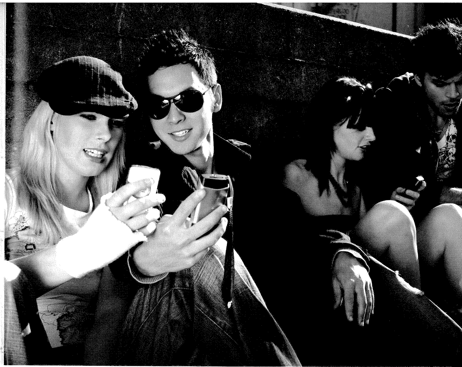
Door mobiele telefoons met internet en camera is er niet één Big Brother , maar zijn er vele Little Brothers .

"Daarbij komt dat iedereen tegenwoordig een mobieltje heeft met foto- en filmmogelijkheden. Gevolg is dat we ons steeds meer bewust worden van het feit dat gekke en rare handelingen door andere mensen vastgelegd en verspreid kunnen worden. Wanneer de intieme levenssfeer verdwijnt, krijg je modelburgers, oppervlakkige mensen, die steeds alles 'goed' willen doen. Vandaag de dag is het niet alleen de overheid die ons met camera's in de gaten houdt. Door de mobiele telefoons, doen we het