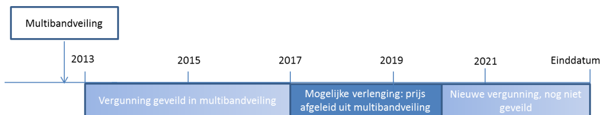
Figuur 2.3 Tijdslijn methodiek bij verlenging 2,1 GHz-vergunningen

Het gaat bij de vergelijkbaarheid van de vergunningen in de eerste plaats om de frequentieband waar de vergunningen betrekking op hebben, aangezien die in hoge mate bepalend is voor de