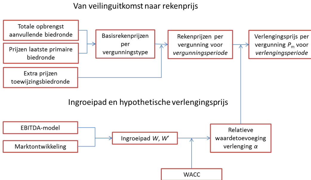
Figuur 2.2 Schematische weergave methodiek vaststelling verlengingsvergoedingen uit multibandveiling

Combinatie van deze twee hoofdelementen geeft de verlengingsprijzen per vergunning. Een en ander is schematisch samengevat in Figuur 2.2.